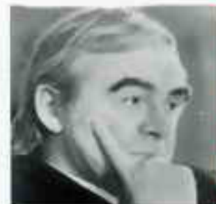
ГРАНИН Д. А., писатель, за интервью «Кому был страшен Зубр» (№ 2).