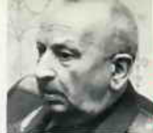
БАЙДУКОВ Г. Ф., Герой Советского Союза, за статью и звуковую страницу «Правда о гибели Чкалова» (№ 7).

На седьмой звуковой странице — романсы А. Варламова «Красный сарафан» (стихи Н. Цыганова), «Белеет парус одинокий» (стихи М. Лермонтова) и «Так и рвется душа» (стихи А. Кольцова) в исполнении Т. Синяеской, Е. Нестеренко, В. Ивановой.