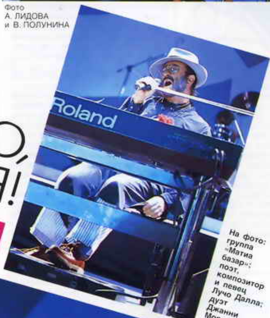
На фото: группа «Матиа базар»; поэт, композитор и певец Лучо Далла; дуэт Джанни Моранди и Лучо Далла.

уже гастролировала в СССР, мне кажется, изменилось.