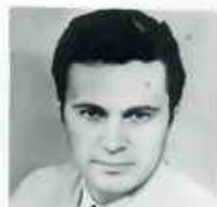
ЛИДОВ А. П., фотокорреспондент, за фотоснимки на обложках (№№ 3, 6, 10).