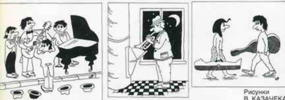
Рисунки В. КАЗАЧЕКА